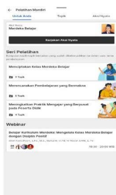
Gambar 3. Tampilan Salah Satu Fitur dalam Platform Merdeka Mengajar

Berdasarkan hasil wawancara yang dilakukan, guru-guru tidak merasa kesulitan untuk menemukan fitur-fitur yang tersedia. Serta tampilan yang dinilai eyecatching oleh seorang guru. Hal ini sesuai dengan penelitian yang dilakukan oleh Sari, Pramesti, Suryanti, & R.S, (2022) bahwa guru tidak merasa kesulitan dalam mengakses fitur-fitur yang tersedia serta halaman awal yang mudah dipahami dan tidak memunculkan pertanyaan yang berarti.