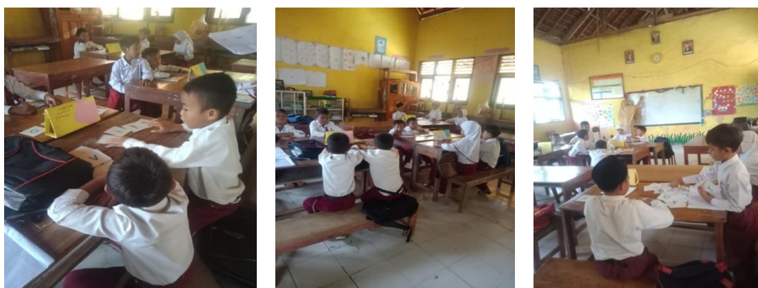
Gambar 3. Pembelajaran pada Level A (pemula dan huruf)

belajar siswa. Setelah siswa siap belajar, siswa di tiap kelompok duduk bersama seperti pada gambar berikut. Peserta didik melakukan belajar sambil bermain menggunakan alat bantu berupa alat peraga kartu huruf, disusun menjadi sebuah kata.