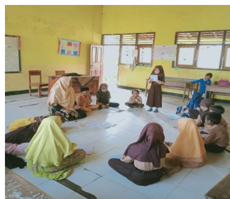
Gambar 5. Pembelajaran pada Level C (Cerita)

Karakteristik siswa pada kelompok pembaca cerita pembaca lancar dan mampu membaca teks yang lebih panjang. Guru perlu fokus pada peningkatan pemahaman bacaan dan penyajian teks yang lebih kompleks, mendorong kreativitas dan membantu