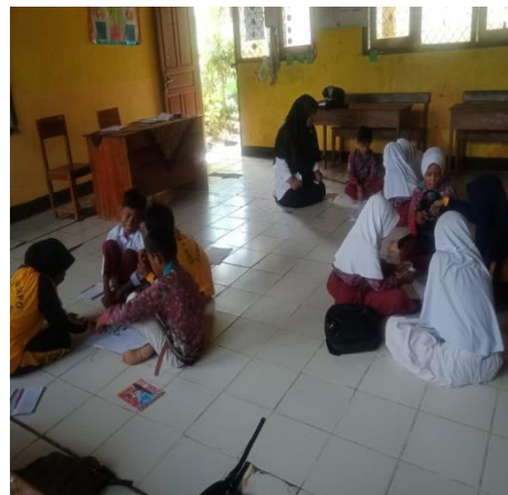
Gambar 4. Pembelajaran pada Level B (Kata dan Paragraf)

Pada level ini dapat memperkuat pemahaman siswa tentang tata bahasa dan tanda baca, menanamkan kebiasaan membaca setiap hari, dan memperkuat pemahaman akan bacaan. Jika siswa mampu membaca paragraf atau cerita pendek dengan lancar, mereka akan lebih siap untuk mulai membaca dan menulis teks yang lebih panjang, dan mulai menggunakan teks untuk memikirkan konsep yang lebih kompleks. Siswa pada level ini melatih kemampuan berpikir kritis mereka melalui aktivitas pemahaman. Dalam kelompok ini, siswa terus mengembangkan kelancaran melalui latihan membaca secara rutin. Pada tahap ini anak membangun penguasaan akan teks, mengembangkan kepercayaan diri, dan menikmati